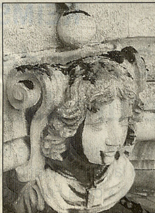
Un ange qui a une vue imprenable sur la cité rose.

I MPOSSIBLE de la rater. La nacelle est depuis plusieurs jours tout contre la Collégiale, à pratiquement 50 mètres